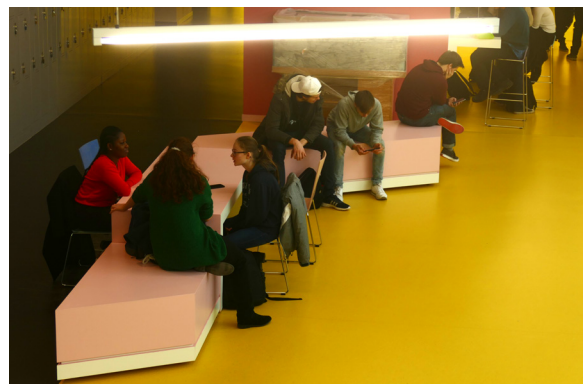
Fotos: Die Aufenthaltsbereiche im Neubau der Lise-Meitner-Schule sind als Pausen- und Klönbereiche ebenso gestaltet, wie für Diskussions-Runden oder entspannende Ruhe.