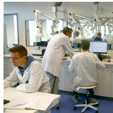
Foto: Eines von mehr als 40 Laboren im Neubau der Lise-Meitner-Schule. Das Gebäude wurde im November 2019 eröffnet.

Wir möchten, dass Du nicht nur einen Ausbildungsplatz findest, sondern wir möchten Dir auch die Kenntnisse und Fähigkeiten mitgeben, um in der Ausbildung zu bestehen und anschließend erfolgreich im Bereich der Naturwissenschaften zu arbeiten.