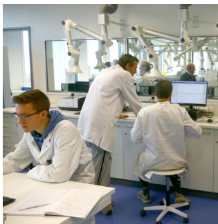
Foto: Eines von mehr als 40 Laboren im Neubau der Lise-Meitner-Schule. Das Gebäude wurde im November 2019 eröffnet.